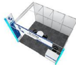
■ Bird's Eye View